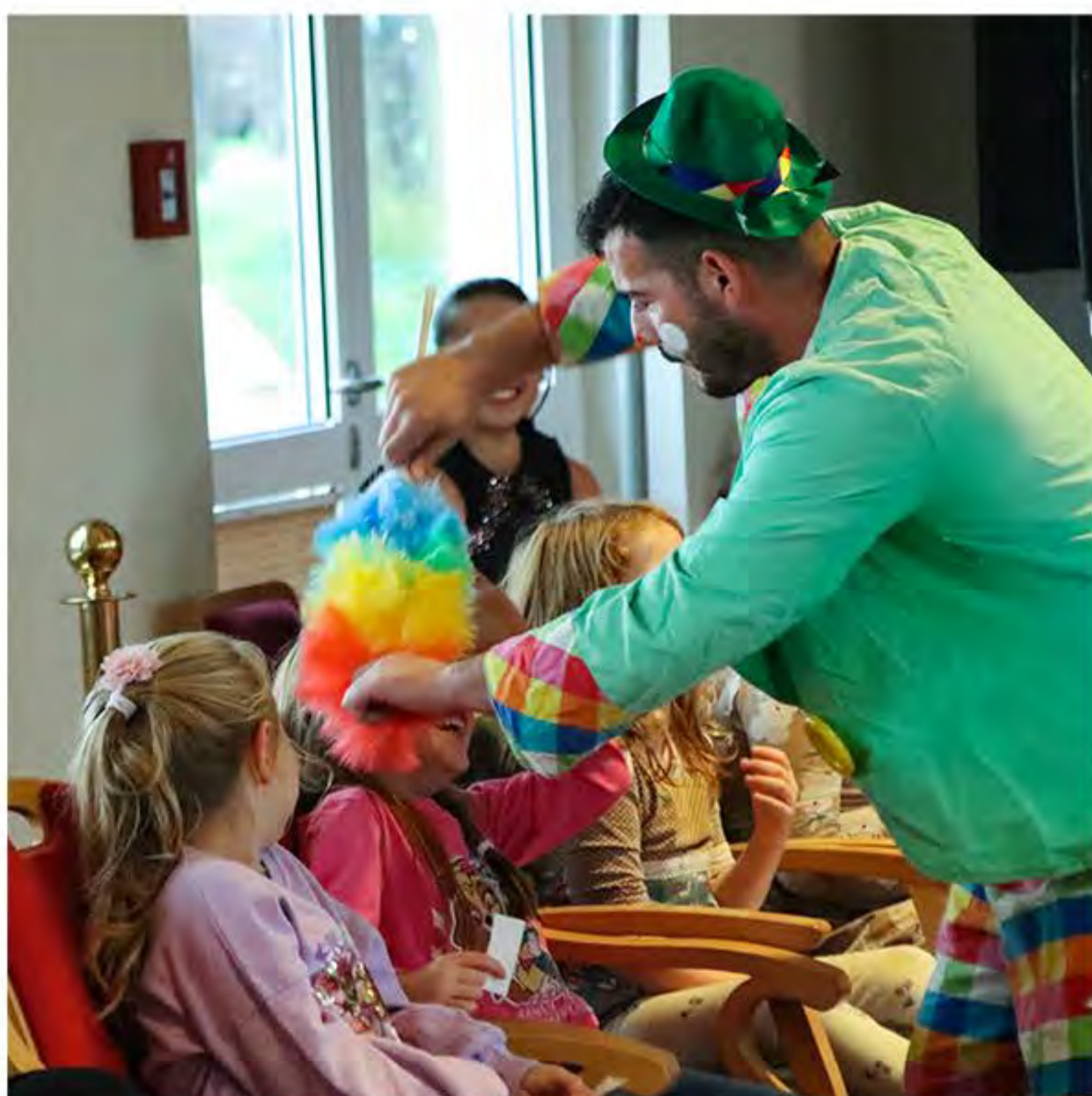
Einmal ordentlich den Staub weggewischt!

Mandy Politz Fachassistentin des Geschäftsführers