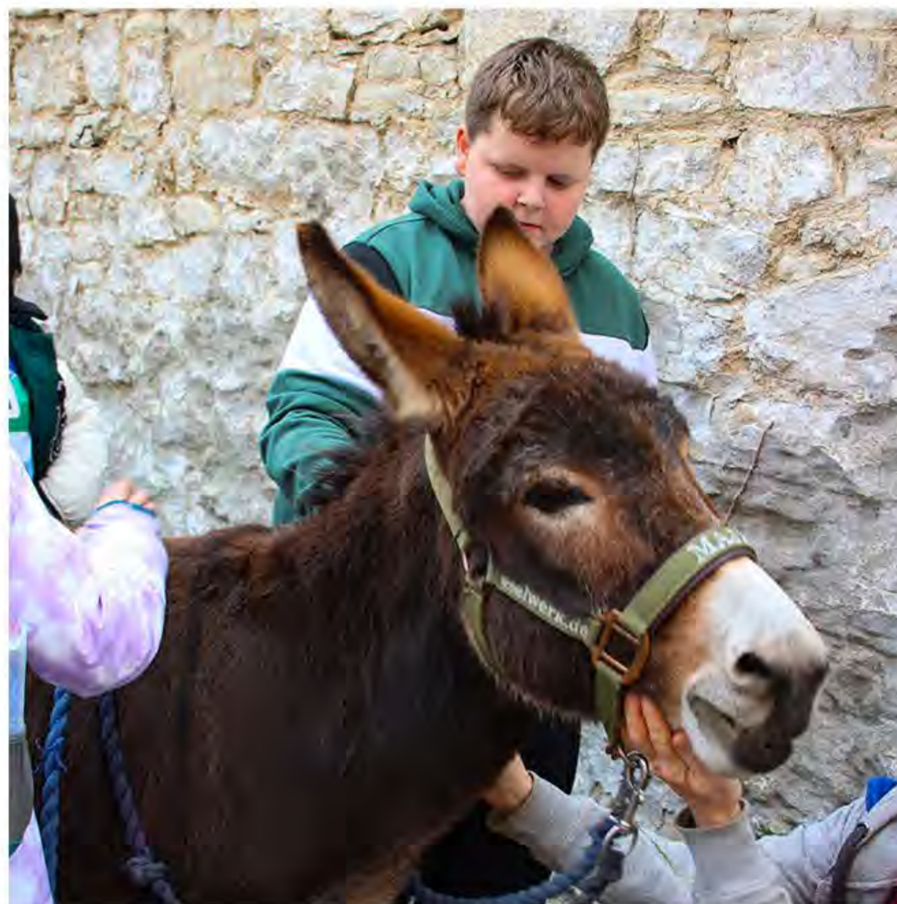
Natürlich gab es auch echte Grautiere zum Anfassen

Ein besonderer Höhepunkt des Tages war die Führung durch das ehemalige Gefängnis, das sich im selben Gebäude wie die Tafel und Tafelbibliothek befindet. Die Kinder waren von den spannenden Geschichten und der schaurigen Atmosphäre begeistert. Doch der größte Anziehungspunkt war der Besuch der Esel von der Eselfarm Derenburg. Die Kinder durften die Esel streicheln und mit ihnen spazieren gehen, was für viele ein unvergessliches Erlebnis war.