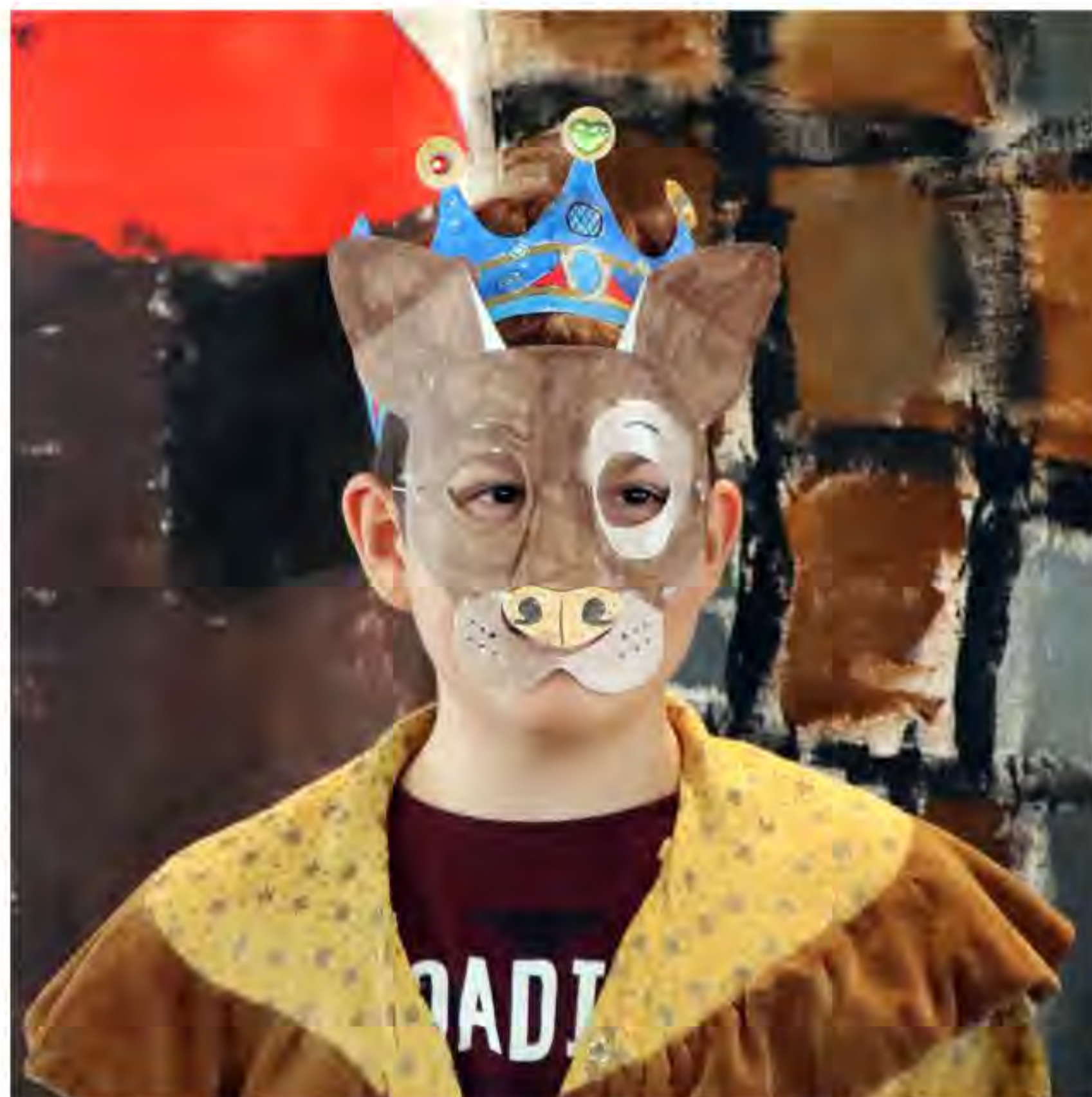
Der kleine Apfelkönig lässt niemanden an seine Äpfel

Die Kinder waren dabei hoch motiviert und ließen ihrer Kreativität freien Lauf. Gerade an den Bühnenbildern arbeiteten teilweise bis zu zehn Kinder gleichzeitig, um das Reich des Apfelkönigs lebendig werden zu lassen. Die Rollen konnten sich die Kinder selbst aussuchen, was ihnen ebenfalls sehr gut gefiel. Auch ein Tanz wurde einstudiert, damit das Theaterstück mit viel Schwung enden konnte. An den Nachmittagen durfte sich dann auch mal so richtig ausgetobt werden.