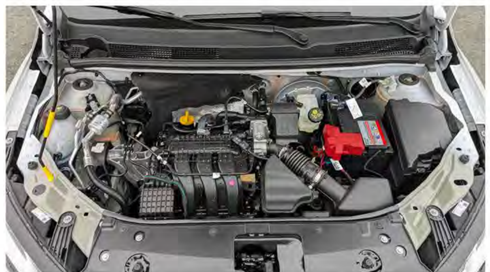
Große Freude bei der AWO über das neue Fahrzeug. Der Dank geht an die „Aktion Mensch“