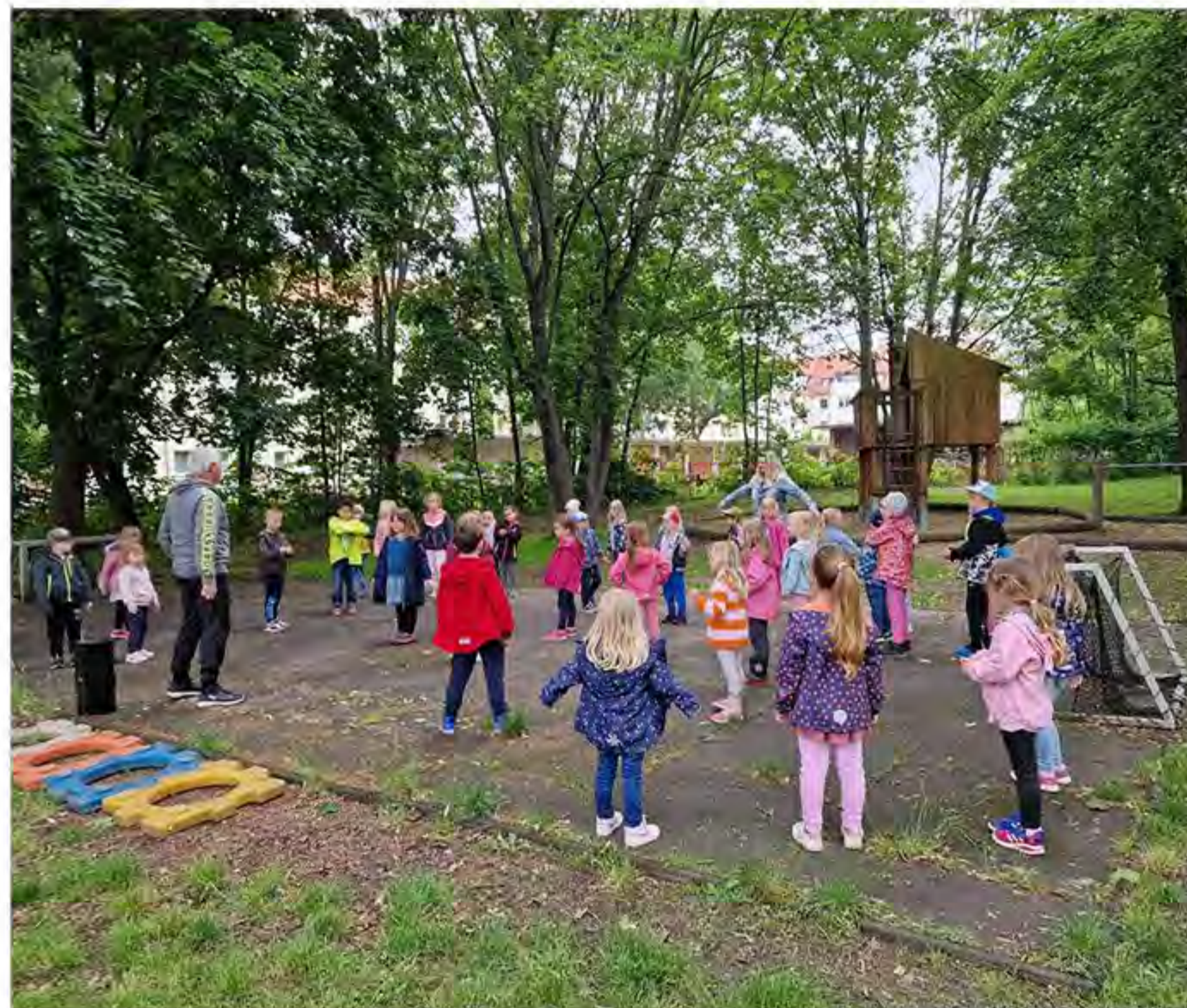
Die kleinen Pfiffikuse lernen alles wichtige über das Verhalten im Straßenverkehr

Die Kinder verschiedensten Alters haben sich mutig und motiviert an die Hindernisse gewagt. Für Abwechslung wurde gesorgt: durch einen Tunnel krabbeln, im Entengang vorwärts gelangen, über einen Pfad balancieren, über Hindernisse hüpfen oder mit Bällen ein bestimmtes Ziel treffen – der Parcours war vielseitig und wurde von den meisten Kindern sogar wiederholt gemeistert. Die Anforderungen an Balance, Gleichgewichtssinn und physischer Fähigkeiten waren groß. Was einem Kind leicht fiel, stellte für ein anderes ein Übungsfeld dar und andersrum. Nicht jeder Sprung und jede Höhe ließ sich so ohne Weiteres meistern. Manch ein Kind zweifelte, schätzte ab und hielt inne. Wir haben gelernt, dass nicht nur Mut das Gegenteil von Angst ist. Überwindet man die Angst, gewinnt man Selbstvertrauen. Vertrauen in das eigene „ich schaff das schon.“