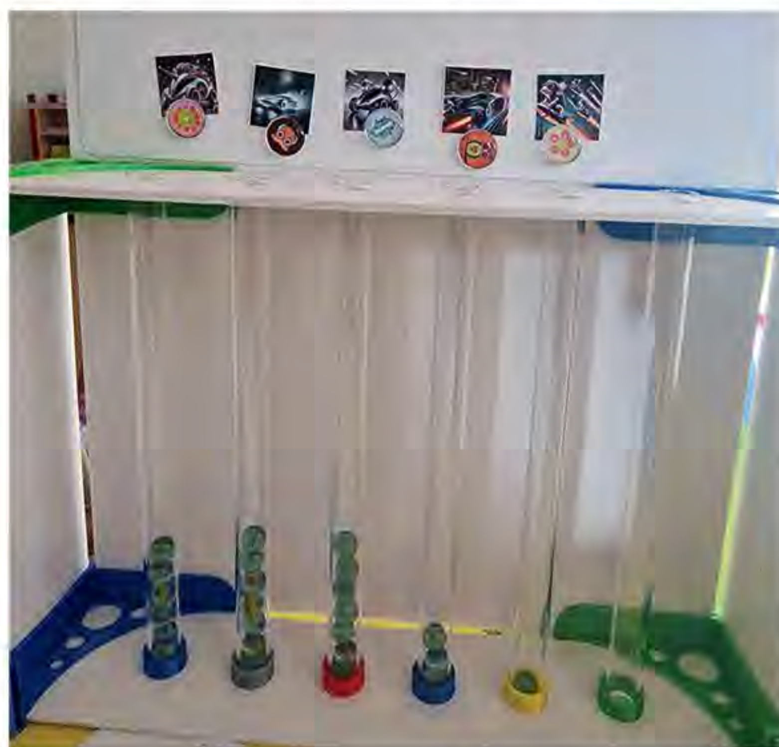
Abgestimmt wurde mit Glasmurmeln