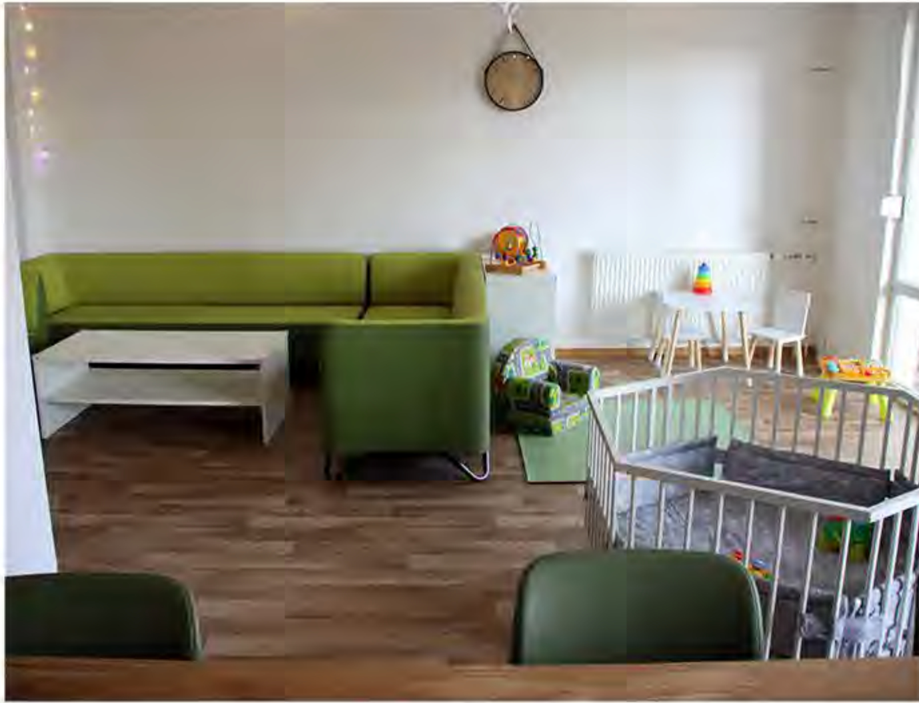
Der neue Wohnbereich „Elternwohnen“ im Haus Mathilde

Auf der ersten Etage im „Haus Mathilde“ des AWO Kreisverbandes Harz e.V. war die vergangenen Monate reges Treiben zu beobachten. Die stationäre Jugendhilfeeinrichtung wurde in der Gartenstraße 38 in Quedlinburg um den Bereich „Elternwohnen“ erweitert. Jetzt, pünktlich zum Jahresende, sind die Umbauarbeiten so gut wie abgeschlossen und den ersten Einzug hat es auch schon gegeben. Der Bereich „Elternwohnen“ bietet den Eltern und Kindern gemütliche Zimmer mit mehreren Betten, die je nach Bedarf individuell angepasst werden können. Dazu ist an jedem der Zimmer ein kleines Bad angeschlossen, was nicht selbstverständlich ist. Daneben bietet der Wohnbereich mehrere Küchen und Aufenthaltsräume in denen gekocht, gespielt oder sich auch mal ganz in Ruhe unterhalten werden kann.