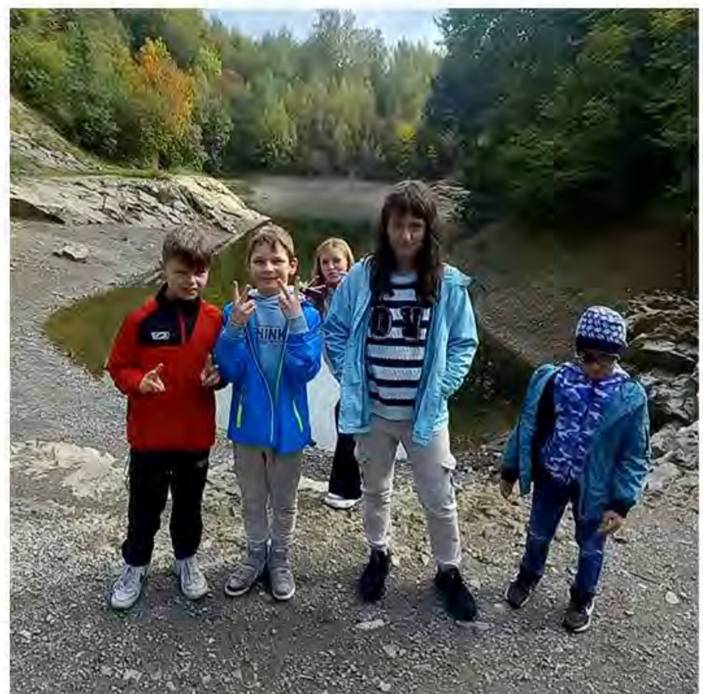
Ein Ausflug in den Harz lohnt sich immer

Um uns auf eine kleine Zeitreise zu begeben, stand am 04. Oktober 2024 ein Ausflug nach Rübeland auf dem Plan. Mit dem Ziel die Baumannshöhle zu erkunden, traten wir Erzieher gemeinsam mit den Kindern des Kinder- und Jugendhauses „Marie-Juchacz“ eine Führung durch die älteste Schauhöhle Deutschlands an. Die ungewohnte Umgebung weckte ein umfassendes Interesse der Kinder an der Höhle. So hörten die Kinder aufmerksam zu, während über die Entdeckung der Baumannshöhle im 16. Jahrhundert und bekannte Besucher wie Goethe gesprochen wurde. Die Tropfsteingebilde faszinierten die Kinder, da mit etwas Fantasie Figuren zu erkennen waren. Im Anschluss fuhren wir zum ortsnahen Blauen See. Hier konnten die erlebten Eindrücke ausgewertet werden. In der Natur konnten sich die Kinder die Beine vertreten, bevor wir zum gemeinsamen Abendessen und der Heimreise nach Harzgerode aufbrachen. Eine positive Rückmeldung der Kinder rundete den spannenden Ausflug ab.