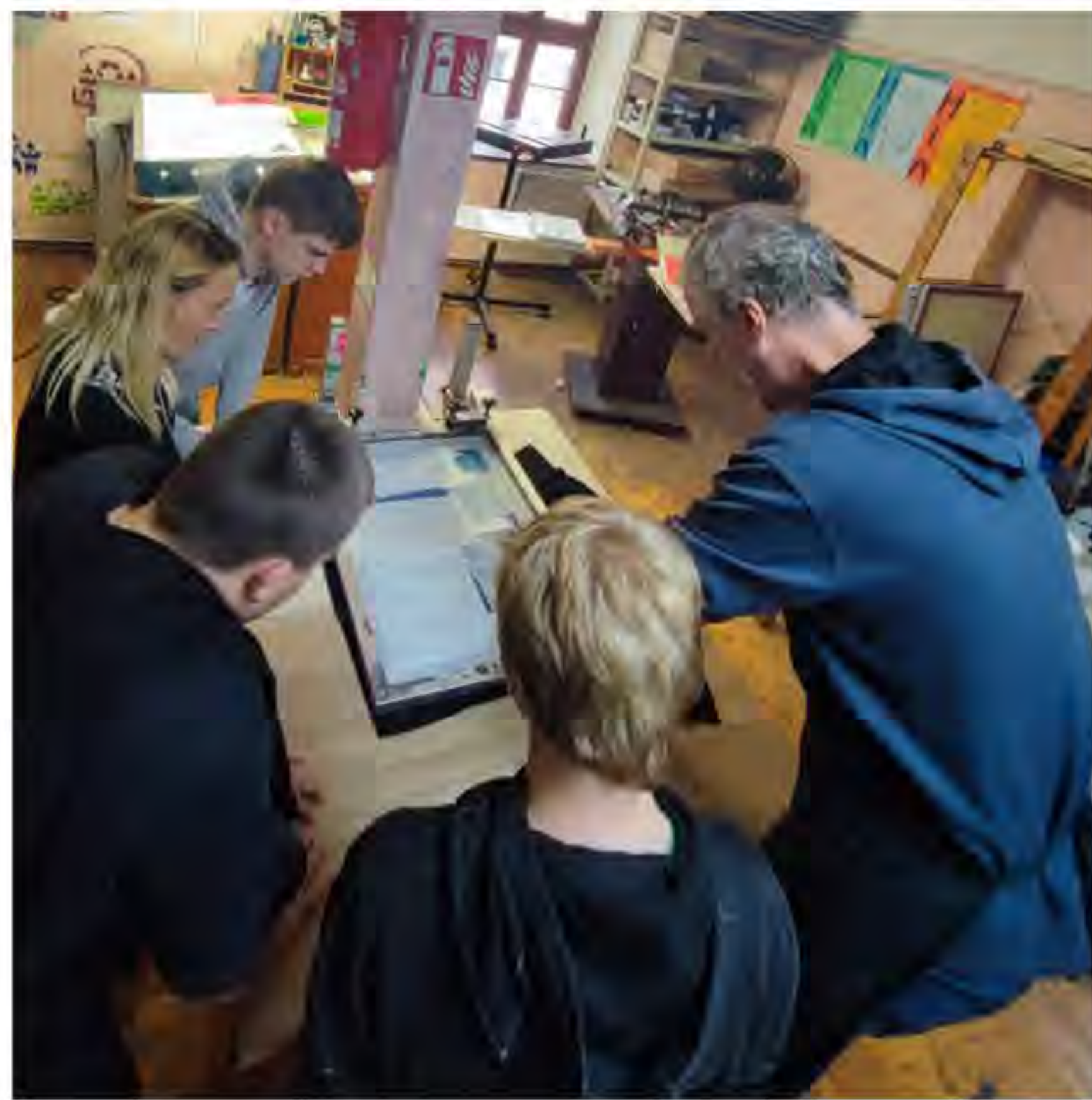
Gemeinsames Arbeiten in der ZORA in Halberstadt

Um den Blick der Jugendlichen auf andere Einrichtungen im Umkreis und teilweise vergessene oder wenig beachtete Tätigkeiten zu lenken, wurde gemeinsam mit dem Soziokulturellen Zentrum Zora e.V. in Halberstadt eine Workshopwoche entwickelt. Die Wahl fiel auf den Verein, da dort sowohl personell, als auch technisch die Möglichkeit besteht, mittels Siebdruckverfahren Drucke eigenständig zu erstellen. Hieraus entstand die Idee, dass die Jugendlichen die Möglichkeit bekommen sollten, selbstgewählte Motive auf T-Shirts oder Beutel drucken zu können und nebenbei den Prozess von der Motivauswahl bis zum Gedruckten Bild kennenzulernen. Da die Vorbereitung eines Siebes bis zu 24h dauern kann, haben die Jugendlichen zwei Wochen vor dem Workshop Motive für ihren Druck rausgesucht. Jeder Jugendliche hatte am Ende sein eigenes Motiv, das als Vorbereitung dem Verein übermittelt wurde.