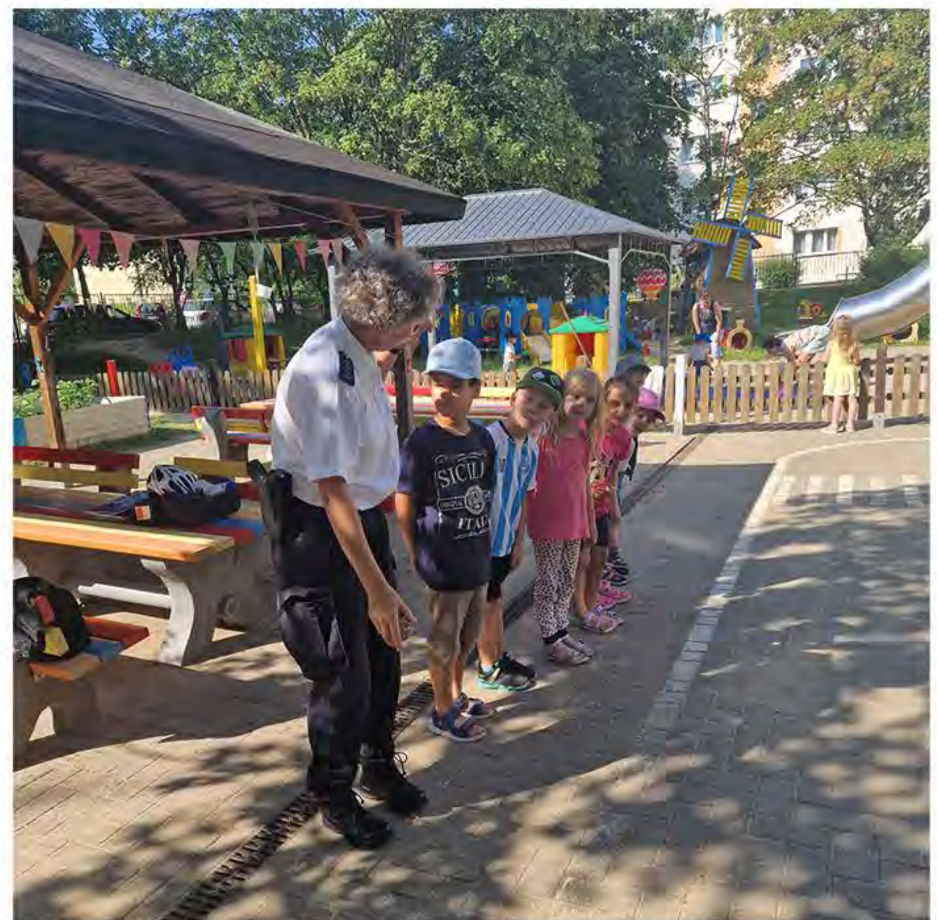
Die kleinen Pfiffikuse lernen alles wichtige über das Verhalten im Straßenverkehr