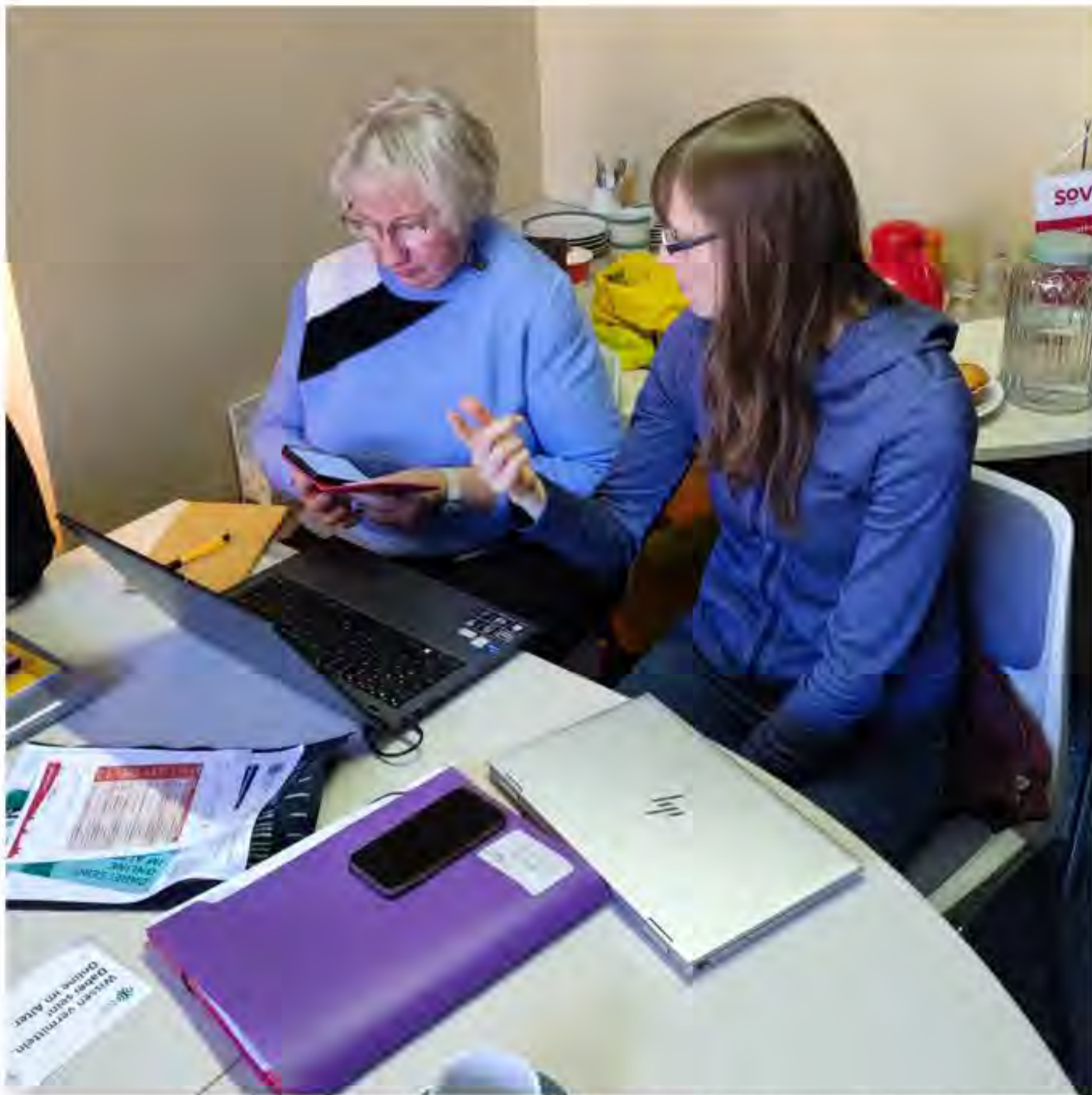
Gerade für ältere Menschen stellen Handy und Co. eine neue Herausforderung dar

Online einkaufen, Messengerdienste nutzen oder das eigene Zuhause zum Smart Home umrüsten: Das alles sind längst nicht mehr Dinge, mit denen sich nur junge Leute auskennen. Ganz im Gegenteil! Auch immer mehr Seniorinnen und Senioren wagen den Schritt in die digitale Welt. Neben einem eigenen PC besitzen mittlerweile auch viele ältere Menschen ein Smartphone, Laptop oder Tablet. Ist ja auch praktisch und faszinierend, was man damit alles machen kann. Allerdings gibt es für den sicheren Umgang mit Internet und Co. auch einiges zu beachten. Und genau dabei hat der „Digitale Engel“ am 23. Oktober 2024 in Quedlinburg seine Hilfe angeboten.