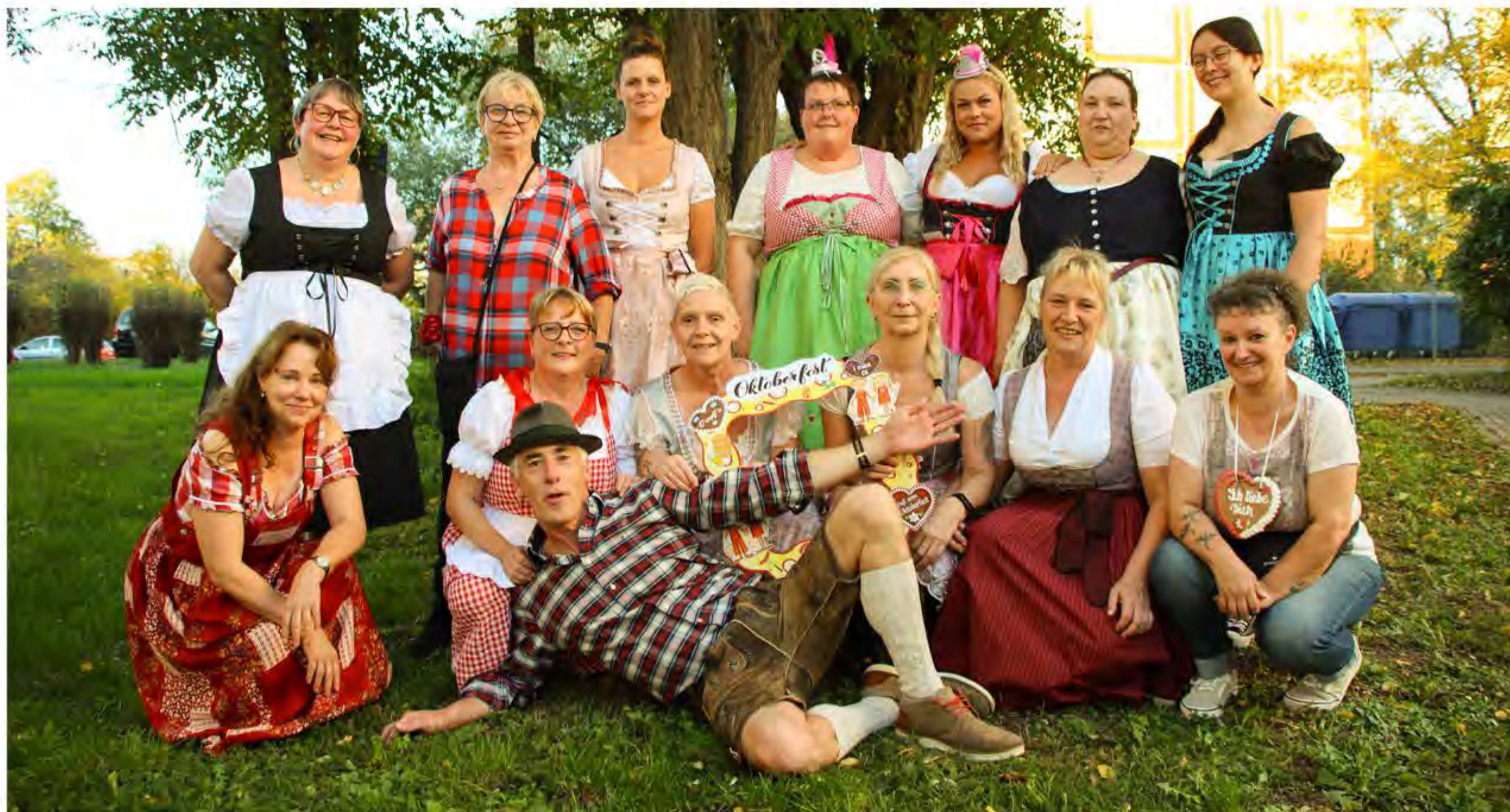
Fröhliche Stimmung beim AWO-Oktoberfest 2024

Die großen Oktoberfeste in München und Co. waren bereits zu Ende, aber in Quedlinburg war das noch lange kein Grund, sich nicht doch noch einmal in Dirndl und Lederhosen zu stürzen, um dem trüben Herbstwetter mit einer zünftigen Feier entgegenzuwirken. Das dachte sich am Dienstag, den 22. Oktober 2024 das AWO Familien- und Pflegezentrum „Am Kleers“ und richtete den Gemeinschaftsraum „Luzie Romberg“ in allerbesten Oktoberfest-Ambiente her. Statt dem bayerischen blau-weiß dominierten die Farben Rot und Weiß der Arbeiterwohlfahrt. Zahlreiche Bewohnerinnen und Bewohner versammelten sich an den reich gedeckten Tischen und stimmten sich auf das angekündigte Programm ein.