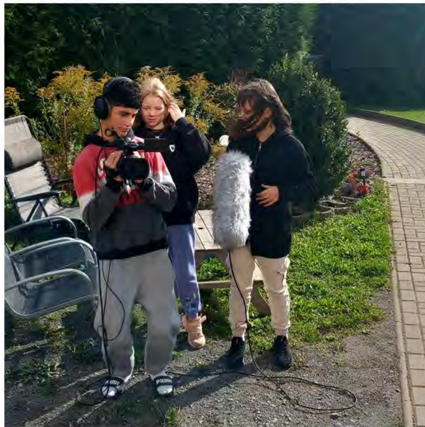
Einmal mit einer professionellen Kamera arbeiten - an diesem Tag gab es die Gelegenheit dazu

Auch die Aufnahmen in Ton und Bild tätigten sie alleine. Ziel dieses Filmprojektes war es, die neuen Informationen kreativ aufzuarbeiten und praxisbezogen anwenden zu können. Sie haben gelernt wie vielseitig und auch aufwendig eine Medienproduktion ist und wieviel Spaß es macht als Gruppe ein gemeinsam etwas herzustellen.