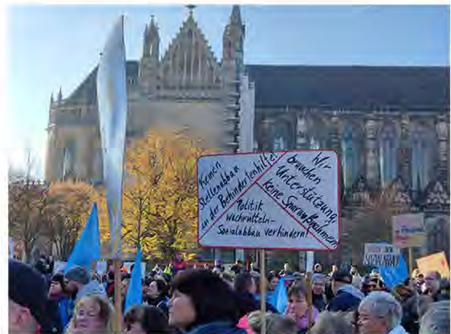
Protesttag in Magdeburg

Jennifer Scheppan - Teamleitung AWO Tagesstätte „ Hoffnung “