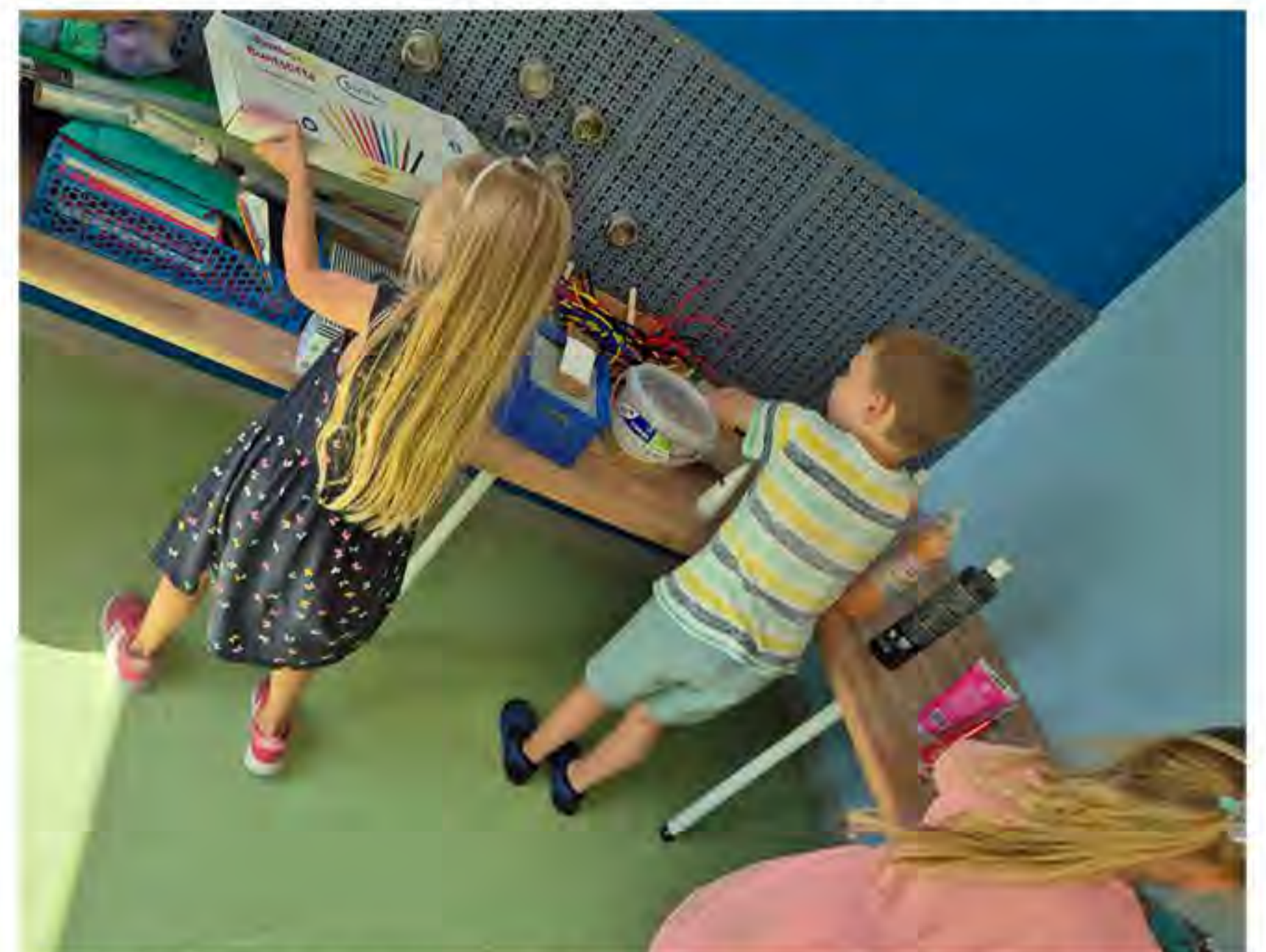
Die Ilse-Kinder entwickeln in ihren neuen Räumlichkeiten ganz viele kreative Ideen

Stephanie Müller Einrichtungsleitung AWO Kinderhaus an der Ilse