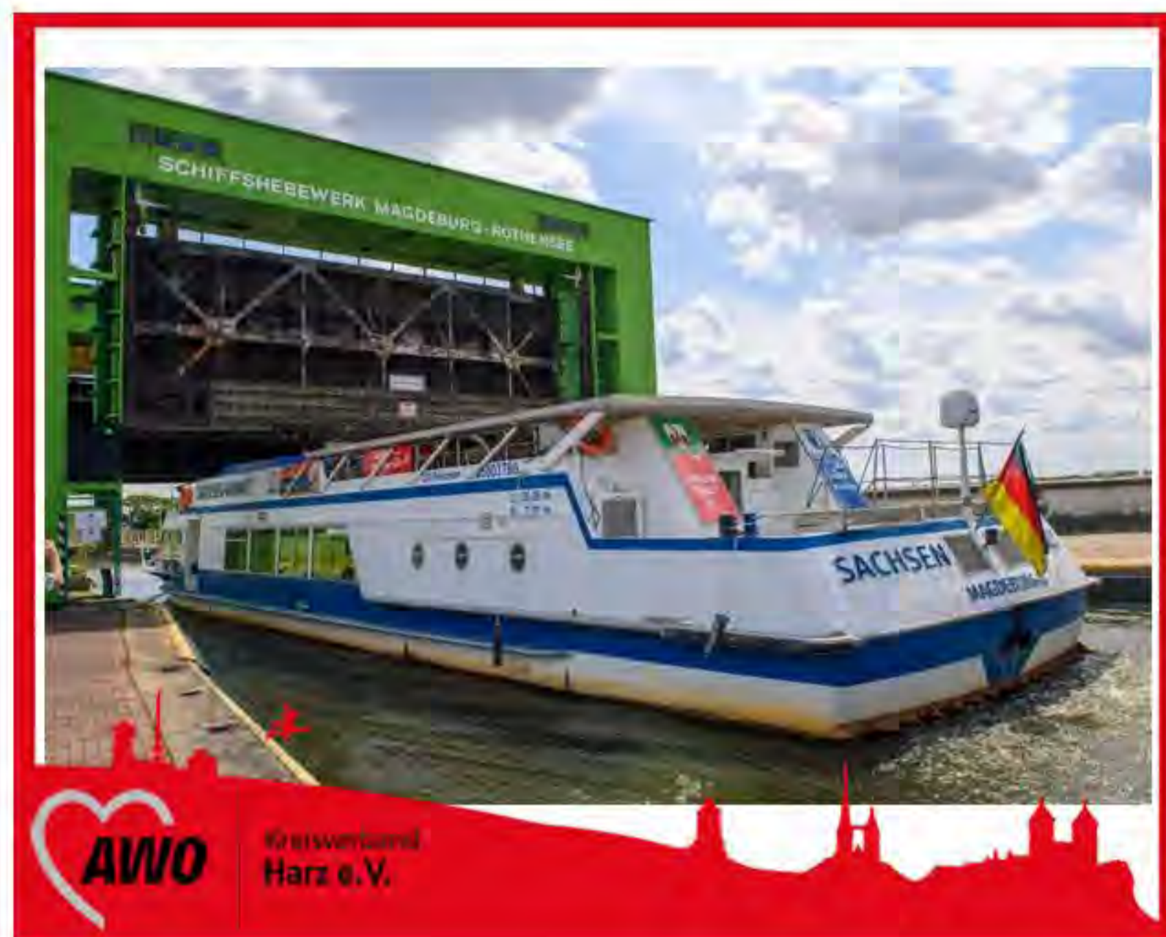
Das Schiff legt ab!

An der Anlegestelle Petriförder angekommen, konnten wir auch schon an Bord gehen. Natürlich kaperten wir das Oberdeck. Hier gab es Sonne, frische Luft, die beste Aussicht und ein Dach über den Köpfen. So lautete unsere offizielle Route: