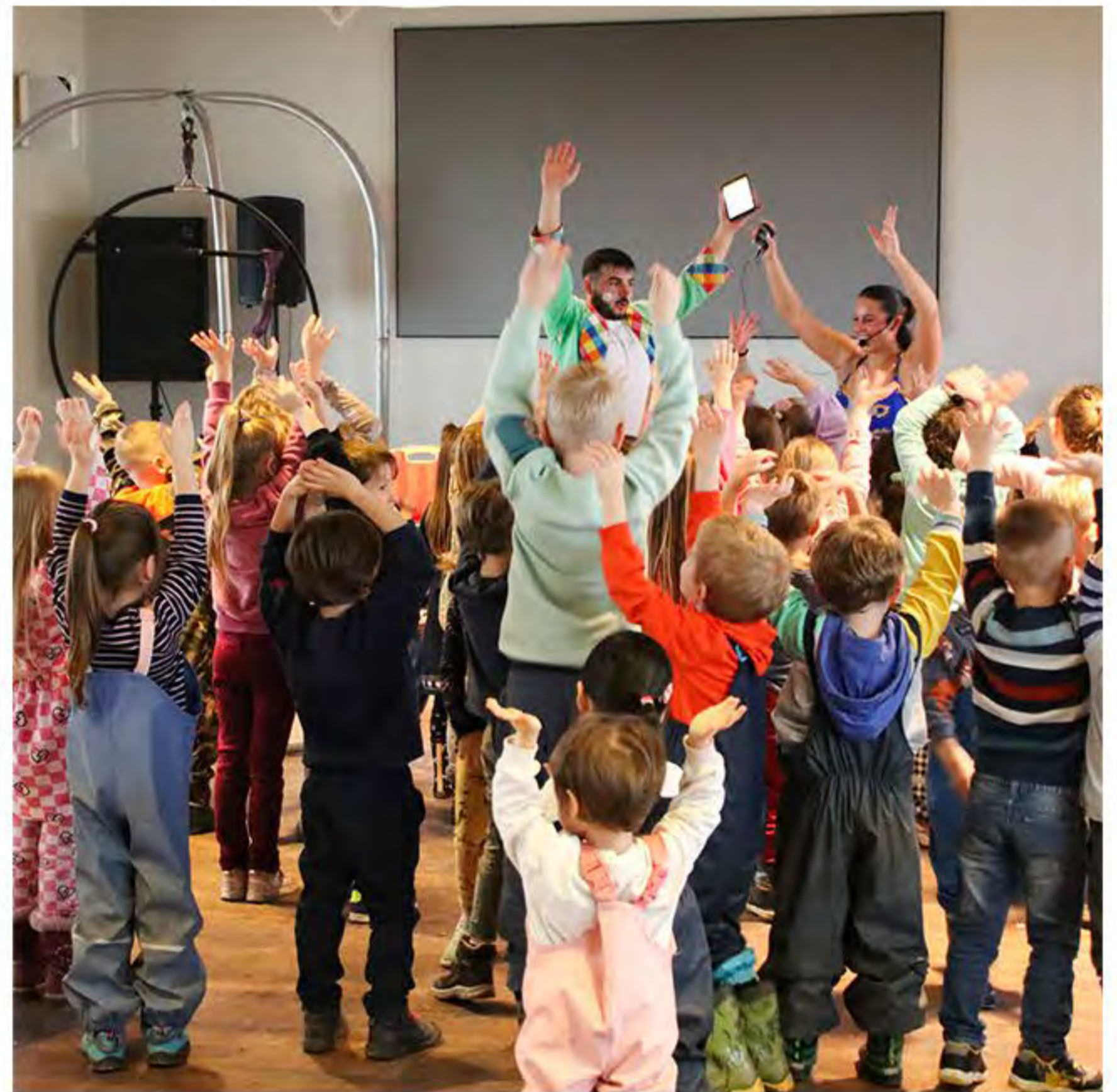
Nach dem Zuschauen endlich selbst mal so richtig austoben

Die Artistin sorgte mit einem rasanten Kleiderwechsel für Staunen im Publikum. Sie lud einige Zuschauer ein, sich am Hula-Hoop-Reifen auszuprobieren, bevor sie selbst beeindruckende Kunststücke mit mehreren Reifen vorführte. Die Kinder waren besonders begeistert, als sie die Möglichkeit hatten, Seilspringen zu probieren – sogar mit verbundenen Augen!